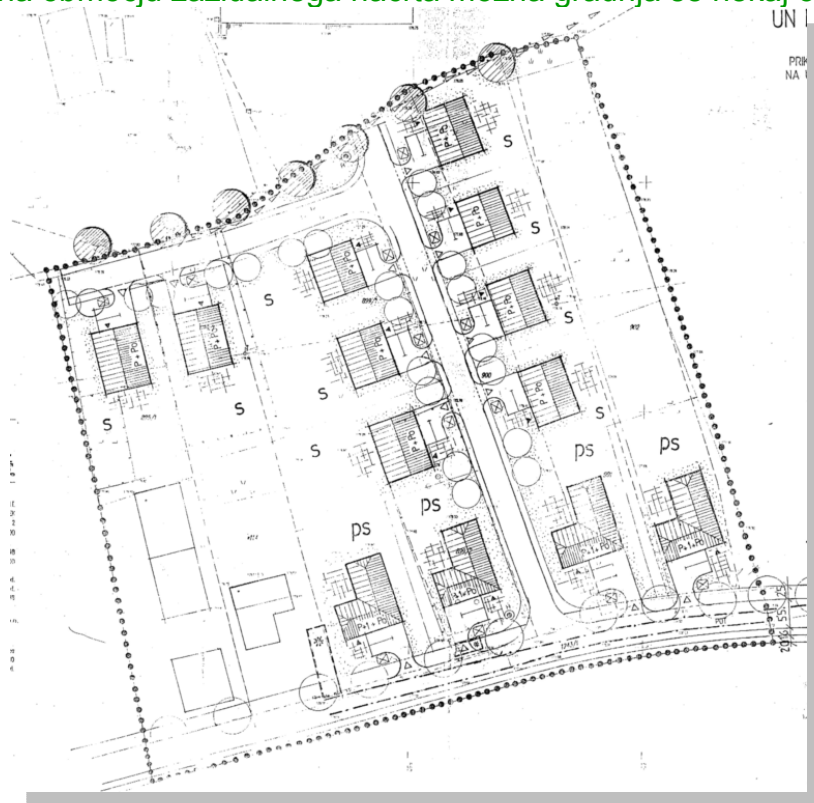
Izsek iz grafičnega dela ZN

ne spreminjajo zasnove območja kot je določeno v zazidalnem načrtu. Glede na stanje v prostoru je na območju zazidalnega načrta možna gradnja še nekaj objektov.